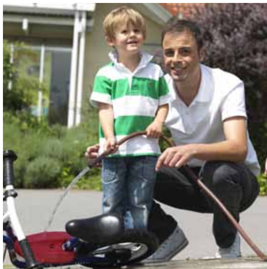
Für eine sichere Zukunft: Die GenerationenRente.

Die Beiträge für die GenerationenRente zahlen Sie. Und das nur für einen begrenzten Zeitraum. Sobald das Kind die Beitragszahlung selbst übernehmen kann (ab der Volljährigkeit), können Sie diese Aufgabe dem Nachwuchs übertragen. Damit hilft eine Generation der nächsten.