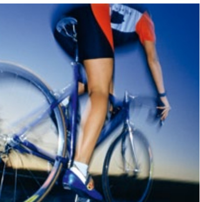
SPORT Förderung der SV schafft Perspektiven SEITE 10