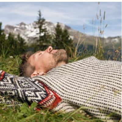
SICHERHEIT Altersvorsorge mit der SV krisenfest SEITE 6