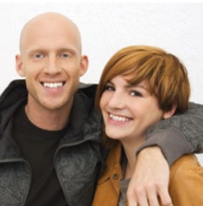
RENTE MIT 60 Altersgrenze wird 2012 angehoben SEITE 4