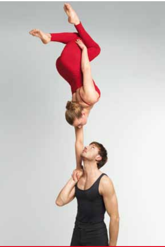
In die Höhe streben - mit Sicherheit: SV IndexGarant

Aktienanlagen versprechen langfristig hohe Erträge. Allerdings kann es bei einer Direktanlage an den Börsen auch Kapitalverluste geben. Bei SV IndexGarant ist das anders: Kapitalverlust ist ausgeschlossen und Ihre Altersversorgung ist gesichert.