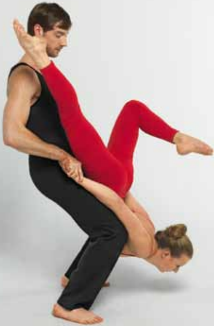
Flexibilität in jeder Lebenslage: SV IndexGarant.

SV IndexGarant können Sie ganz flexibel gestalten: Beim Abschluss des Vertrages, während der Laufzeit und bei der Auszahlung.