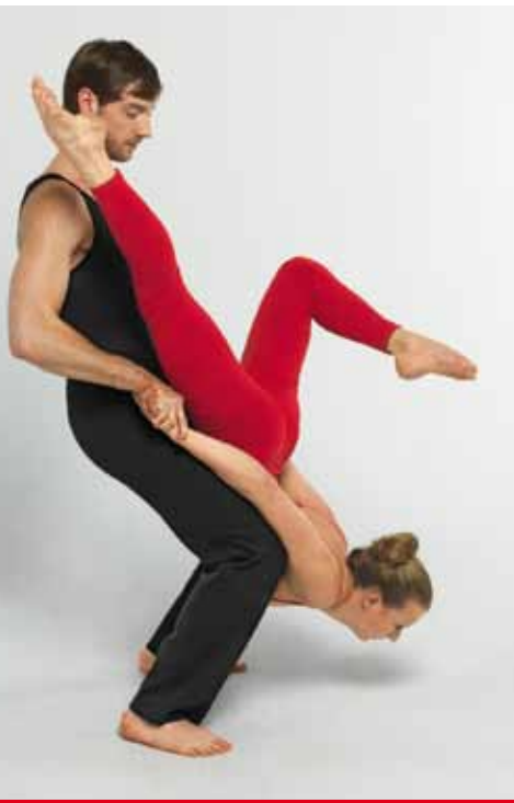
Flexibilität in jeder Lebenslage: SV IndexGarant.

SV IndexGarant können Sie ganz flexibel gestalten: Beim Abschluss des Vertrages, während der Laufzeit und bei der Auszahlung.