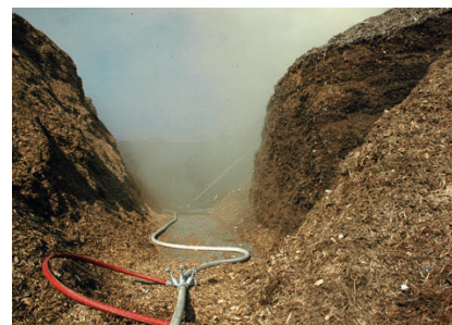
Das Löschen eines Biomassebrands ist sehr langwierig und schwierig, da große Mengen brennbaren Materials involviert sind. Unentdeckte Schwell- und Glutnester können auch nach dem ersten Löscheinsatz wieder zum Ausbruch des Feuers führen.

Als „Induktionszeit“ wird die Zeit vom Beginn der Lagerung bis zur Selbstentzündung definiert. Das heißt, um eine sichere Lagerung zu gewährleisten, ist es erforderlich, das Material vor Ablauf der Induktionszeit umzulagern.