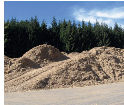
Beim Anlegen der Hackschnitzelhalde wurde diese befahren. Die höhere Verdichtung begünstigt die Selbstentzündungsgefahr.