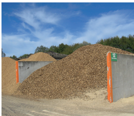
Gute Lösung – Hackschnitzel in unterschiedlichen Korngrößen getrennt gelagert