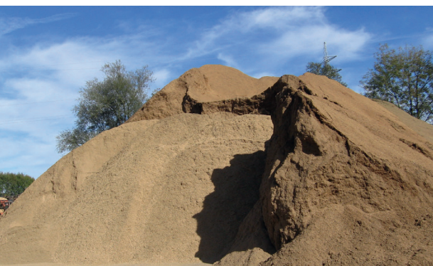
Das Prinzip „first in – first out“ wurde hier nicht beachtet.